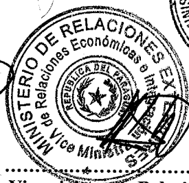
Viceministra de Relaciones Económicas e Integración