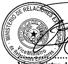
Viceministro de Relaciones Exteriores

Firmado en la ciudad de Asunción, a los días del mes de agosto del año 2025.