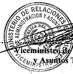
Viceministro de Administración y Asuntos Técnicos